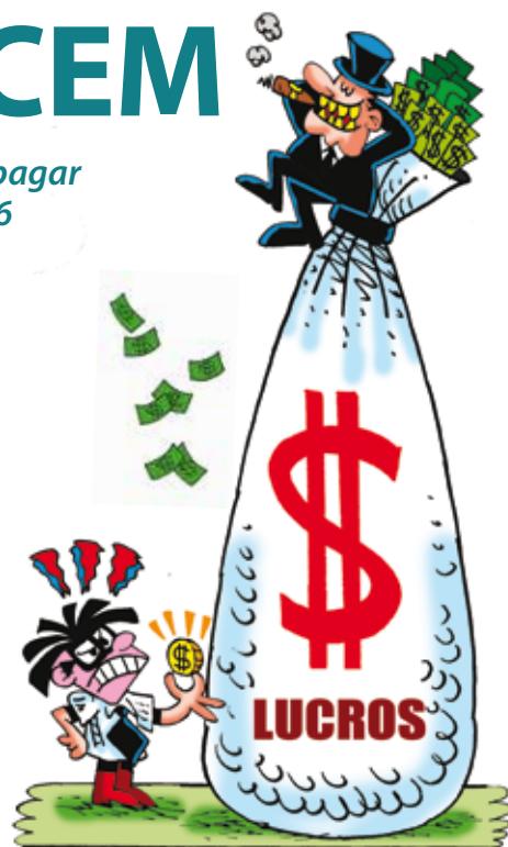
COMPARAÇÃO DA REMUNERAÇÃO DE TRABALHADORES COM A DE UM EXECUTIVO DE BANCO

Os bancários não aceitam isso e vão parar. Se a proposta não mudar, vai ter greve a partir de 6 de outubro e a culpa é dos bancos. ●